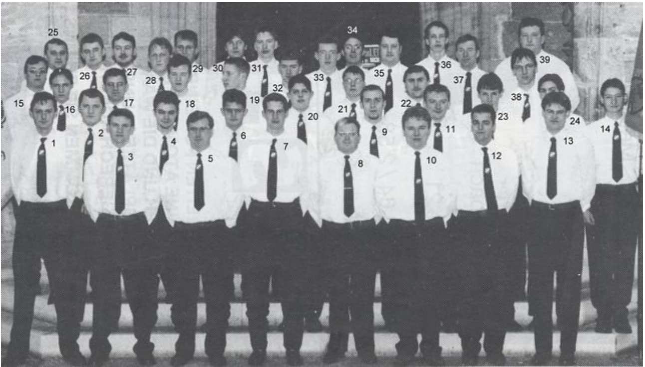
Aufnahme aus der Festschrift zum 90jährigen Jubiläum gescannt, Originalfoto verschollen!